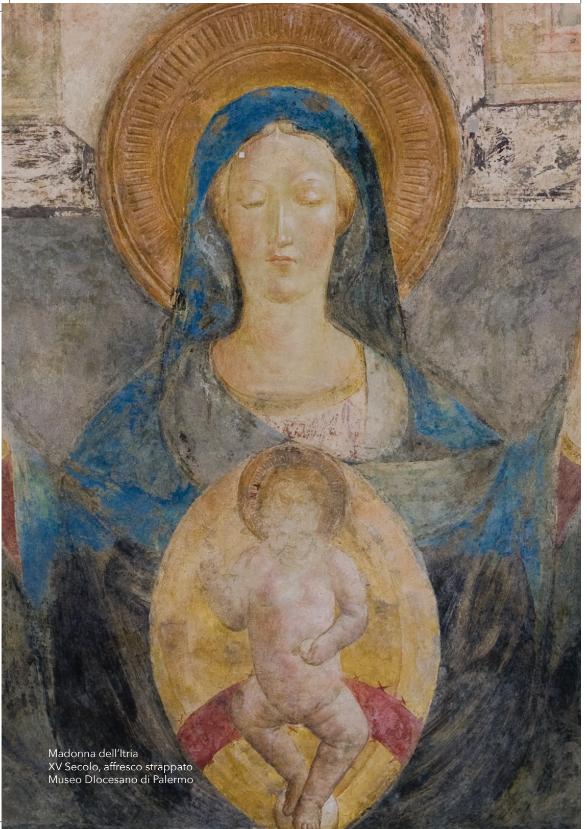
Madonna dell'Itria XV Secolo, affresco strappato Museo Diocesano di Palermo