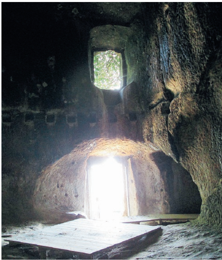
Alia, il paese delle meraviglie Uno splendido scenario naturale, aria pura e tanti monumenti da scoprire. In alto a destra le splendide Grotte della Gurfa. Accanto, a sinistra, i bovini grandi protagonisti di SiciliAlleva

Dalla tecnologia ai fuoristrada, fino ai lavori di carpenteria: un paese dalle inesauribili risorse