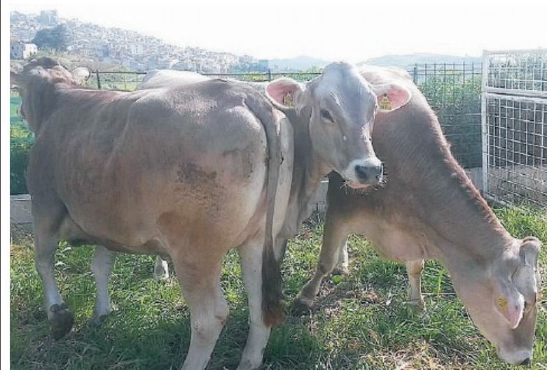
Sicilialleva. I bovini tra i grandi protagonisti della manifestazione

sezione è dedicata agli attrezzi usati per lavorare il grano (aratri, zappe e falvi) e l'ultimo spazio espositivo è riservato agli oggetti del quotidiano come gli arnesi per la tessitura.