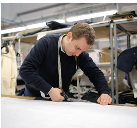
Al lavoro nella Sartoria Infantino