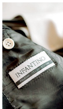
Il brand Infantino

«La collezione si articola su una sottile ricercatezza nei dettagli, nella scelta del tessuto, nell'accostamento dei colori e nella forma. Uno stile all'insegna della misura e della discrezione: sobrio, discreto, rigoroso e naturalmente classico. La ricerca tende alla massima qualità dei tessuti e delle tecniche di lavorazione, facendo diventare protagonisti i dettagli. Cosicché i capi sono confezionati secondo la tradizione dei maestri sarti siciliani e se ne possono apprezzare i contenuti solo indossandoli. Un'eleganza raffinata per niente banale. Tanto che abbiamo clienti che vengono da noi da tutta la Sicilia. Ogni persona diventa espressione di se stessa grazie agli