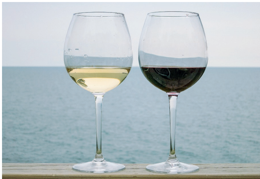
Gli acquirenti nella grande distribuzione premiano il grillo

bacca bianca che presenta acini medio grandi di colore giallo e sferici. L'impianto era tradizionalmente ad alberello, mentre oggi è realizzato con spalliera bassa. Il raccolto è normalmente abbondante, ma non tutti i terreni sono adatti a questo vitigno che ha la particolarità di avere un grado zuccherino molto più elevato rispetto alle altre uve bianche, oltre a particolari proprietà organolettiche. Quanto ai formati, le bottiglie da 0,75 a denominazione d'origine crescono del 2% rispetto all'anno precedente, con 280 milioni di litri venduti. Bene spumanti e champagne, che aumentano del 4,9%, con 68 milioni di litri. Da notare anche la performance del rosato frizzante, che registra +3,9%, come anche le vendite di vino spumante biologico, che superano i 4 milioni di litri. Secondo la ricerca, i vini a denominazione d'origine vendono 5,5 milioni di litri in più nel 2017, così come crescono bollicine e vini bianchi. I vini emergenti si fanno apprezzare per posizionamenti di prezzo non bassi (oltre la metà superiore a 4), che dimostra la disponibilità del consumatore a premiare novità e valore.