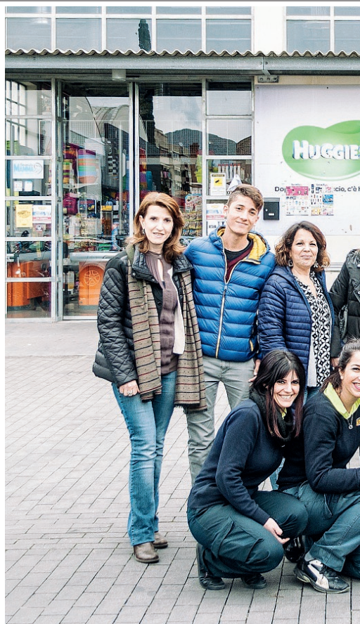
Il team della Sanitaria Demma

Dalla sinergia tra Demma e le migliori aziende sul territorio siciliano, nasce una linea a marchio per la cura del bambino. È una linea pensata anche per le pelli più delicate, a base di sostanze naturali, senza conservanti e allergeni e che rispetta l'ambiente. E il prezzo viene incontro a tutte le esigenze. Altre referenze sono quasi pronte per arricchire la linea, ormai da tempo collaudata. Repellente antizanzare: 100% naturale, a base di una miscela di purissimi oli essenziali, non contiene repellenti chimici. Acqua di colonia: All'olio essenziale della zagara di Sicilia, non contiene conservanti. Quadrotti (60 pezzi): Ideali per detergere anche le pelli più sensibili, senza lasciare residui. Salviette Baby ipoallergeniche (72 pezzi): in tessuto ultrasoffice e dermatologicamente testate ma anche senza alcool, peg, parabeni e phenoxyethanol. Cotton fioc Baby (56 pezzi):